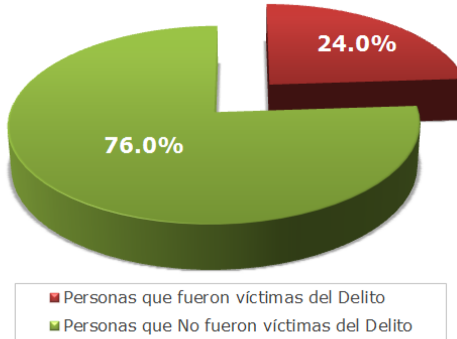
Personas Víctimas del Delito en el 2010

En Inglaterra y Gales el porcentaje de personas víctimas de algún delito durante 2009 fue 21.5% para una población de 16 años y más, mientras que en Canadá este porcentaje fue de 27% para una población de 15 años y más.